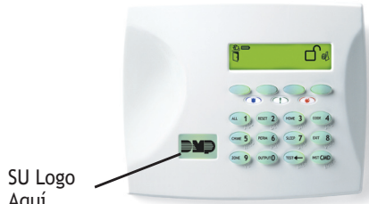
Ubicación Logo Distribuidor

DMP ofrece a distribuidores la opción para presentar el logo de su compañía personalizando sus teclados, substituyendo el logo de DMP. El logo iluminado en color Verde durante la operación normal y cambio a color Rojo en un estado de alarma.