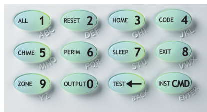
Llaves de atajo

Llaves de atajo de un botón proporcionan acceso fácil y rápido a una variedad de funciones comunes. Manteniendo el botón oprimido en el teclado por dos segundos hará emitir un tono de confirmación de inicio. Por ejemplo, presionar la llave Instant más CMD (Instantáneo, COMMAND) durante la salida detiene la cuenta descendiente para armar inmediatamente el sistema. Los usuarios pueden armar, monitorear las zonas, iniciar una salida fácil, ejecutar una prueba del sistema, restablecer el sistema, agregar usuarios, armar de modo inmediato y contar con una gran variedad de otras funciones.